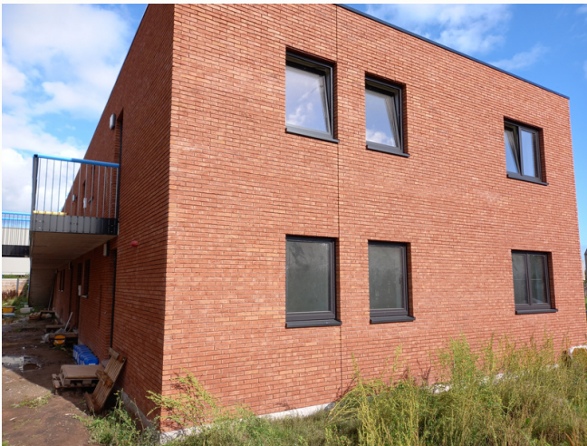
Wuustwezel - Hagelkruisakker (Akkerhof) - 28 huurappartementen