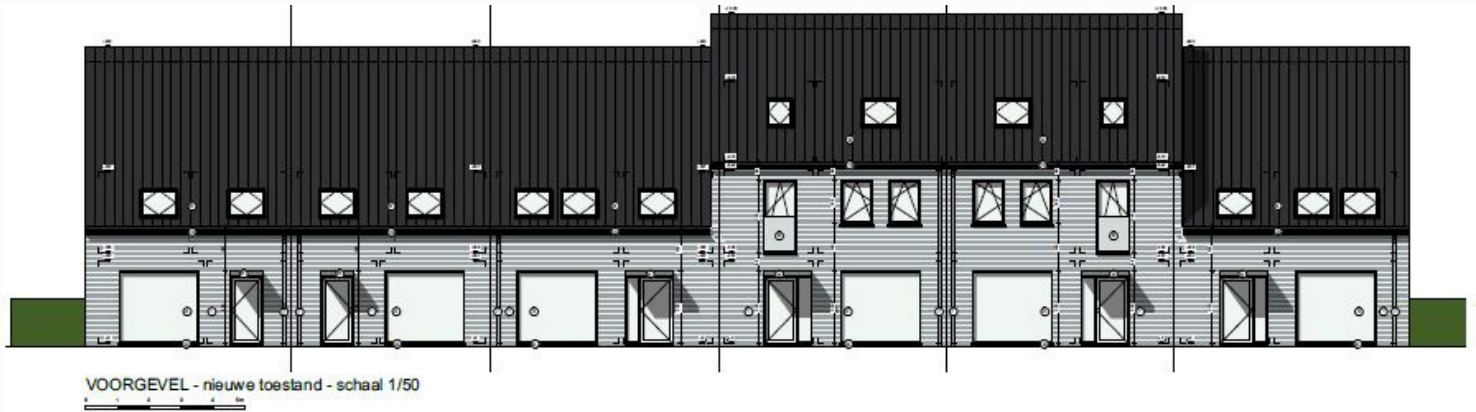
Zoersel - Stoppelveld-Jukschot - 10 ééngezinswoningen