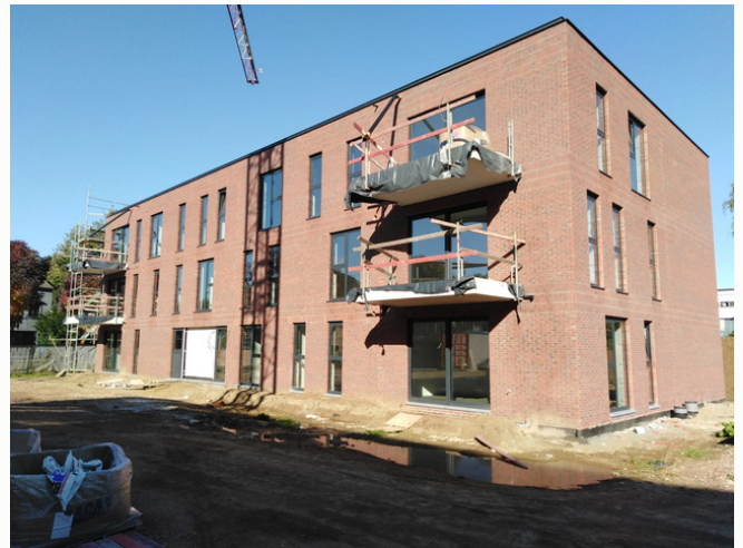
Brasschaat - Beemdenstraat - 10 huur- en 11 koopappartementen